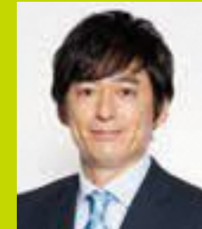
お笑い芸人 博多 大吉